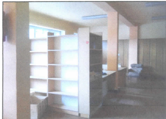
5. Pomieszczenie na parterze