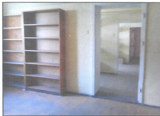
8. Pomieszczenia biurowo – magazynowe w oficynie