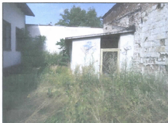
4. Budynek gospodarczy