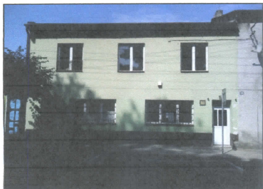
1. Widok od strony ul. Łowickiej