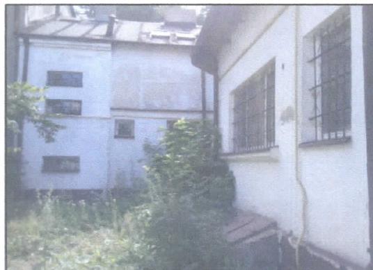
2. Budynek frontowy i oficyna – widok od podwórka