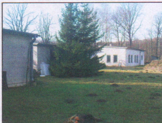
4. Budynek socjalne i gospodarczy