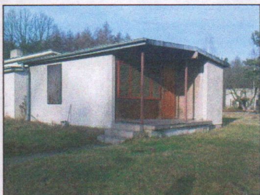
3. Budynek socjalny