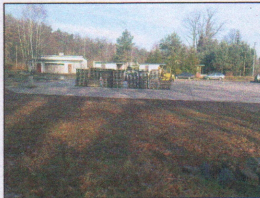
6. Plac betonowy