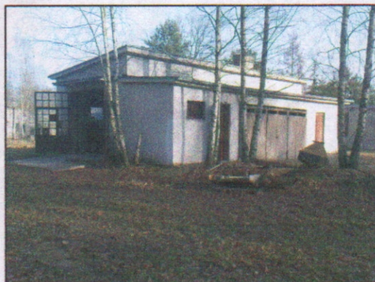
5. Budynek gospodarczy (zbrojarnia)