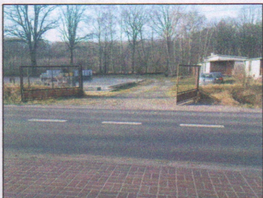
1. Wjazd na nieruchomość