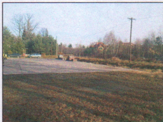
15. Teren nieruchomości