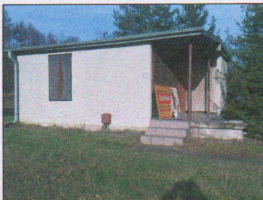
2. Budynek biurowy