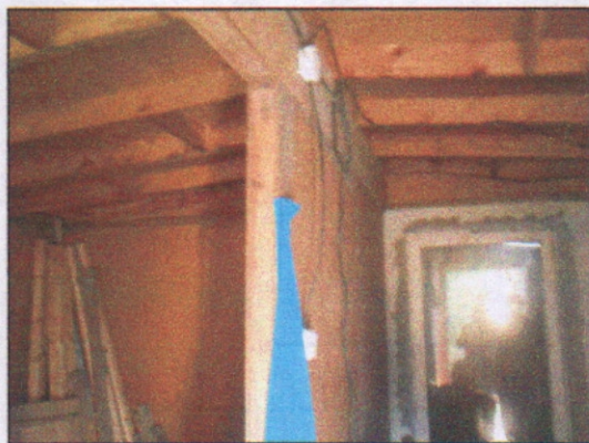
13. Pomieszczenie w budynku socjalnym, konstrukcja