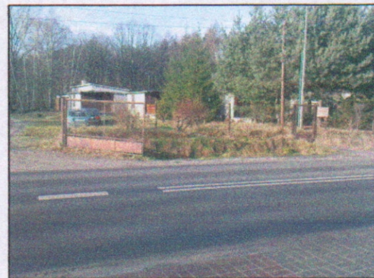
16. Widok od strony ul. Poddębina