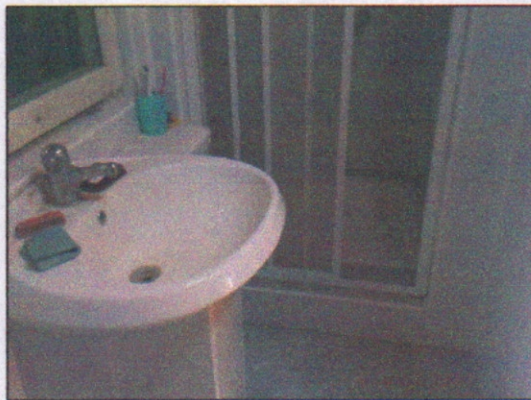
11. Pomieszczenie w budynku socjalnym