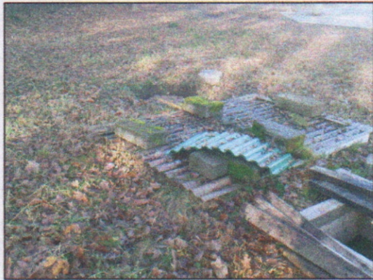
9. Studnia głębinowa