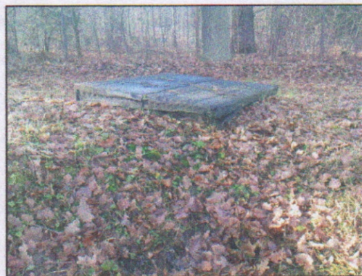
8. Studnia kopana