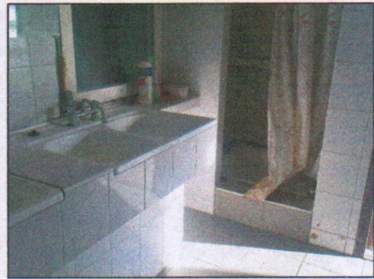
12. Pomieszczenie w budynku socjalnym