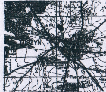
SZKIC ORIENTACYJNY skala 1: 50000