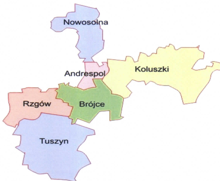
Rysunek 1. Gmina Tuszyn w powiecie łódzkim wschodnim

Gmina Tuszyn zajmuje obszar 130 km 2 . Według danych GUS z końca 2016 roku Gmina liczy 12.233 mieszkańców, a gęstość zaludnienia to w przybliżeniu 94 osoby/km 2 . Gmina Tuszyn leży w południowej części powiatu łódzkiego wschodniego.