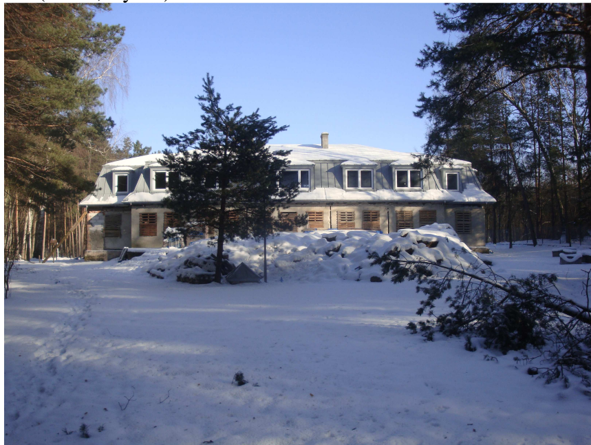
Fot. 3. Budynek mieszkalny, obecnie nieużytkowany na działce nr ew. 161/2

przeznaczony pod zainwestowanie – zabudowę mieszkaniową jednorodzinną i zabudowę letniskową. Natomiast zgodnie z ewidencją gruntów tylko część działki nr ew. 161/2 jest użytkowna, jako tereny mieszkaniowe oznaczone symbolem „B”. Zlokalizowany jest tutaj budynek mieszkalny, obecnie nieużytkowany – pustostan. Pozostała część działki nr ew. 161/2 oraz działki nr ew. 161/4 i 161/16 oznaczone są jako użytki rolne – grunty orne klasy - RVI , w tym zadrzewienia na gruntach ornych, a ponadto grunty leśne, oznaczone symbolem - LsV (Fot. 3, Rys. 3).