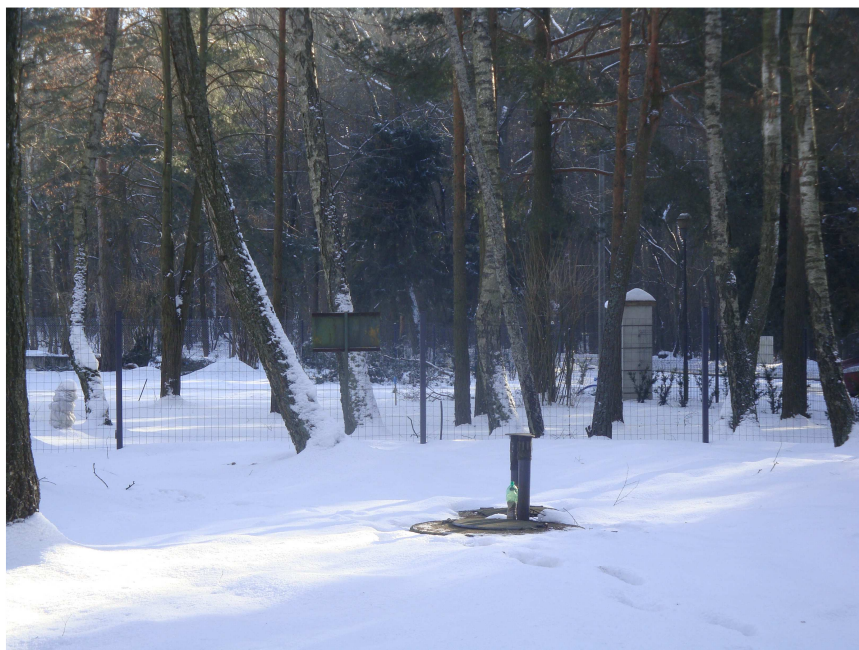
Fot. 1. Ujęcie wód podziemnych w środkowo-zachodniej części planu miejscowego