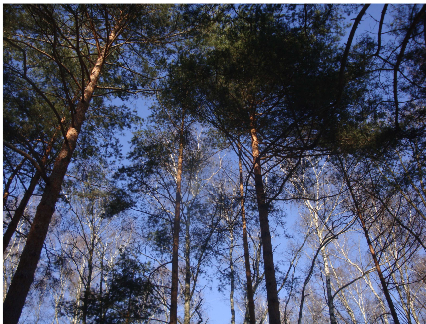
Fot. 2. Bór mieszany świeży (BMśw) w zachodniej części planu miejscowego