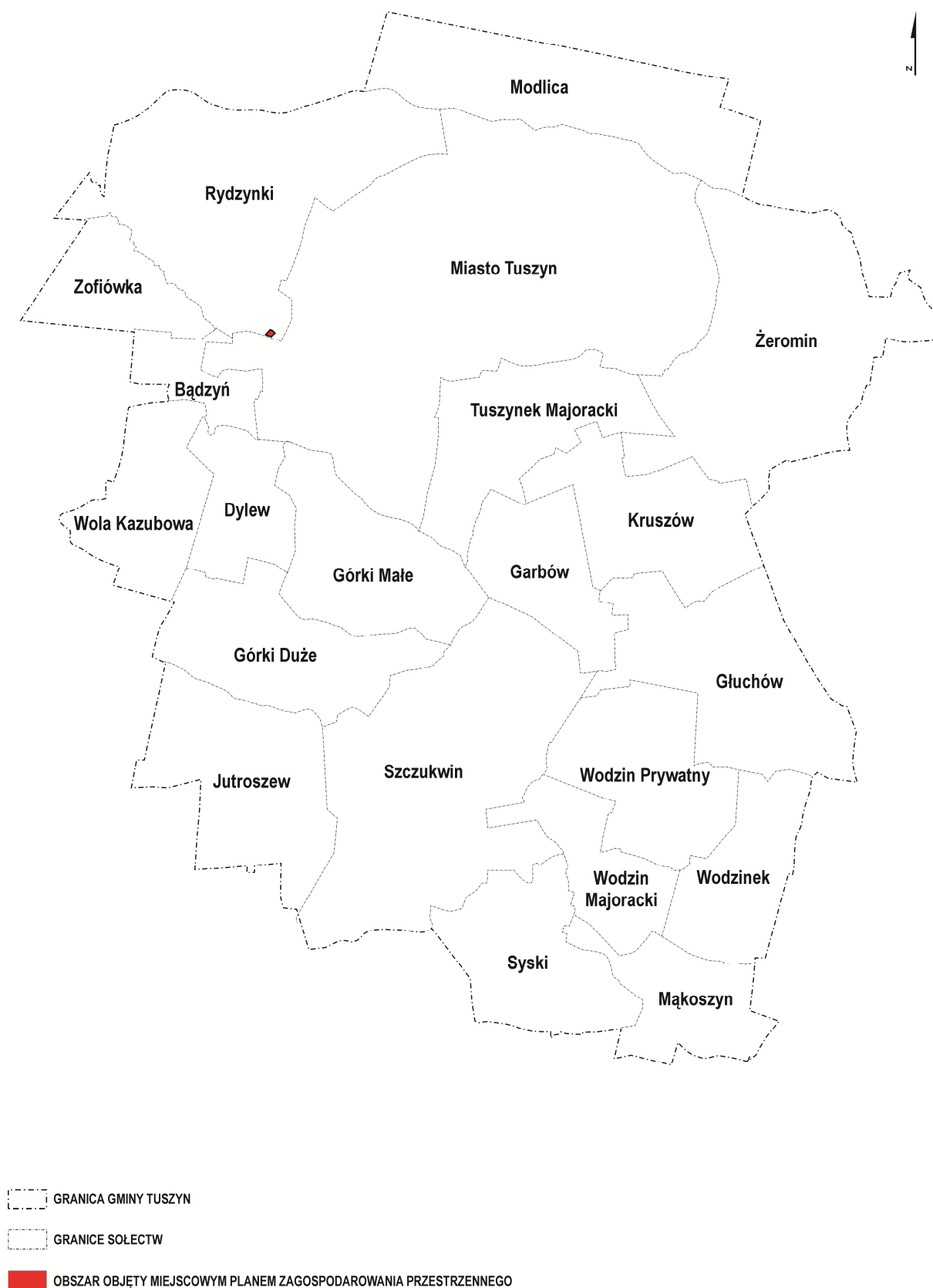
Rys. 1. Lokalizacja obszaru objętego miejscowym planem zagospodarowania przestrzennego, na tle sołectw Gminy Tuszyn